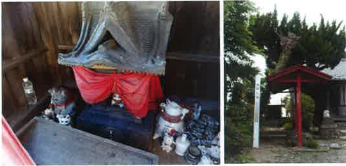
小林(わかばやし)神社/猫塚古墳 宮城県仙台市若林区南小泉1-1-28 アクセス: 仙台駅前より仙台市営バス「若林区役所前」もしくは「南小泉2丁目」下車徒歩約6分