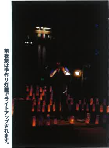
前夜祭は手作り灯籠でライトアップされます。