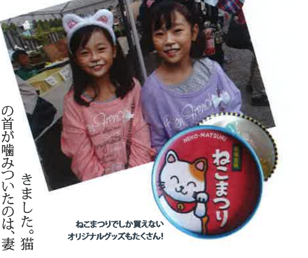
ねこまつりでしか買えないオリジナルグッズもたくさん!