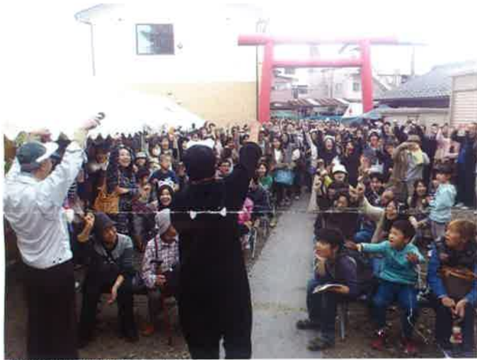
昨年の2時22分22秒の「にやー」